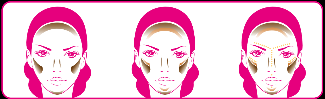
1. CONTOUR: SCOLPISCI

Metti in risalto alcune parti del viso per creare dei punti luce: sotto gli occhi e sulla zona T fino al mento.