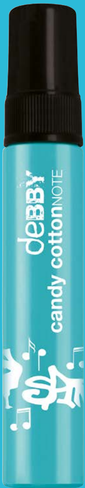
candy cotton NOTE