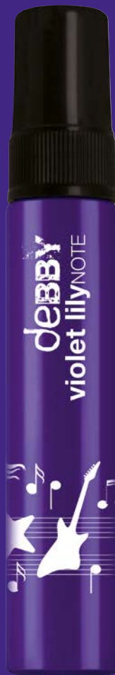
violet lily NOTE