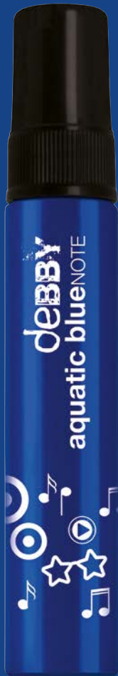
aquatic blue NOTE