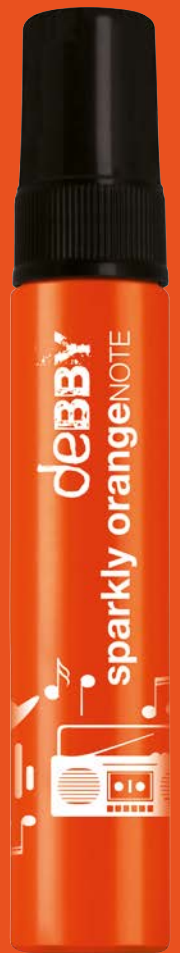
sparkly orange NOTE