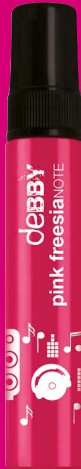
pink freesia NOTE